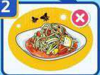
โรคอาหารเป็นพิษ