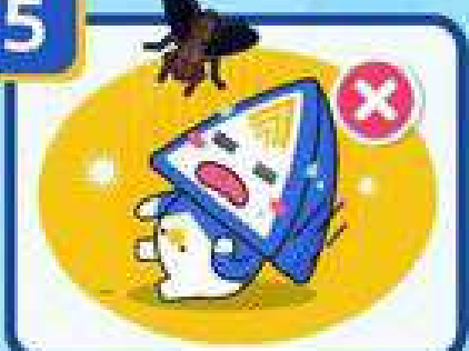
โรคหิวจากโรค