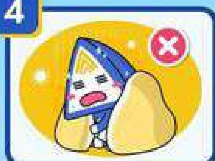
โรคไทฟอยด์